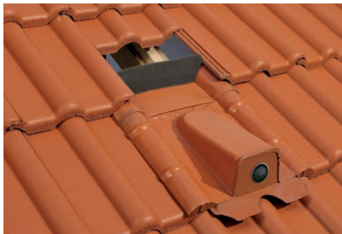
2. Rechts und links Auflage auf Ziegel schaffen