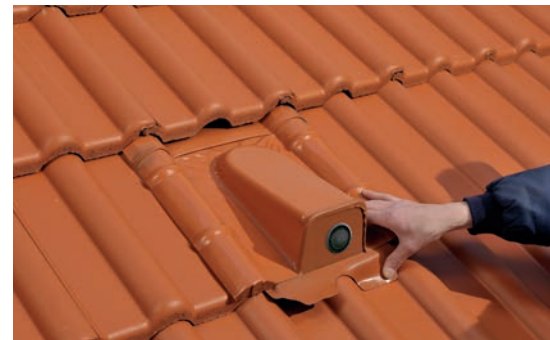
3. Betondachstein eindecken und Bleischürze anformen