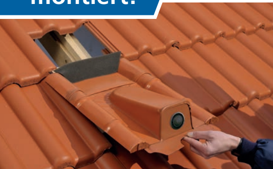
1. Rohrdurchführung einsetzen